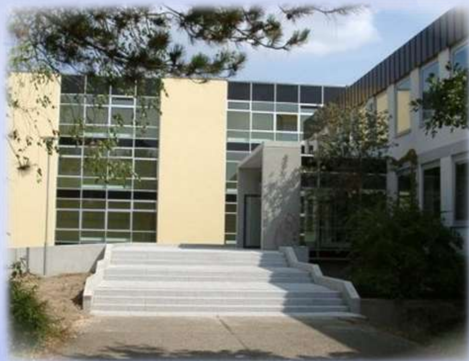
Partnerská škola Německo Günzburg