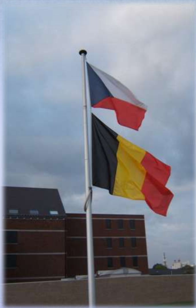
Partnerská škola Belgie Herve